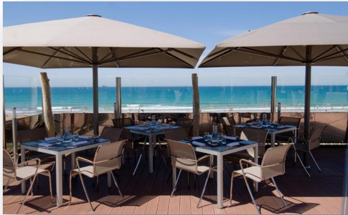
Terrasse de l'Hôtel