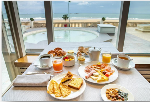
Salle de petit déjeuner